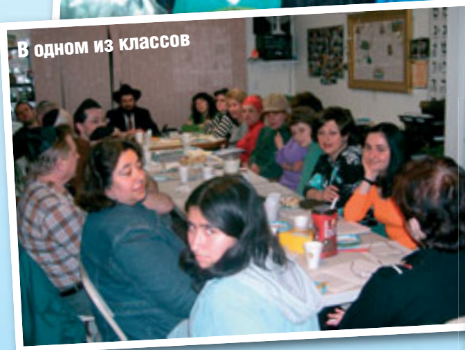
В одном из классов