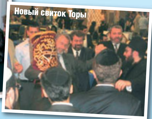
Новый свиток Торы