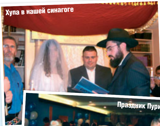
Хупа в нашей синагоге