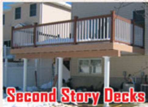
Second Story Decks