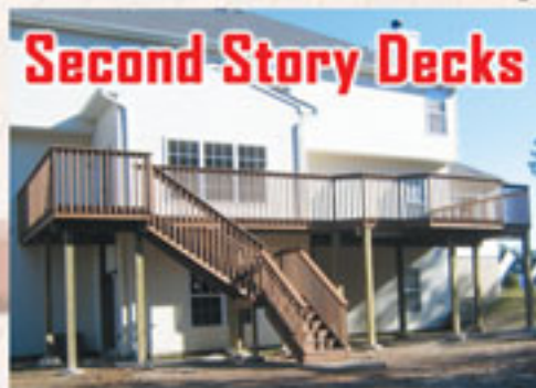
Second Story Decks