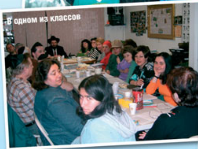
В одном из классов