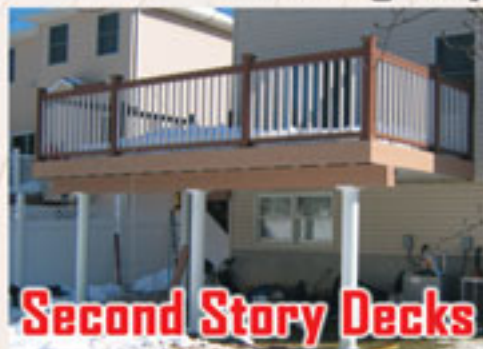
Second Story Decks